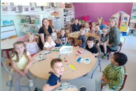
Classe des TPS et PS