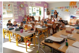
Classe des CP et CE1

La fréquentation des services périscolaires est en hausse avec plus de 45 élèves chaque midi.