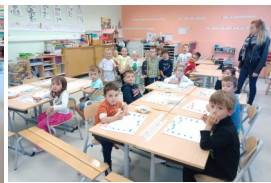
Classe des MS et GS